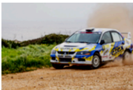
Rallye (Foto generica di repertorio)