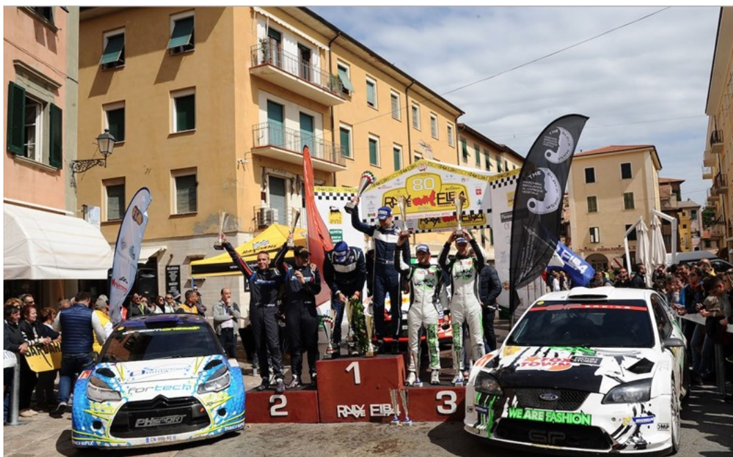
Al via le iscrizioni alla 51esima edizione

La gara dal 24 al 26 maggio, ritorna nel Campionato Italiano