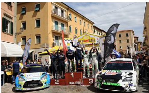
La cerimonia di arrivo 2017

In programma dal 24 al 26 maggio, l'edizione che segna lo storico ritorno della gara nel Campionato Italiano Rally. Dieci le prove speciali previste