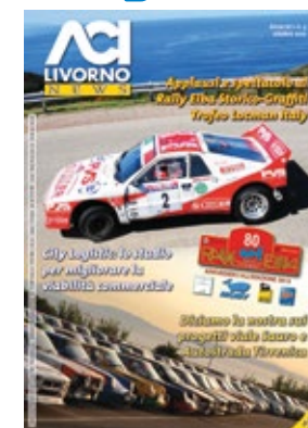
House organ dell'ACI Livorno, stampato in 15.000 copie e distribuito in abbonamento.

L'offerta si completa con l'inserimento del logo aziendale nelle locandine promozionali, sui numeri di gara, negli adesivi ricordo.