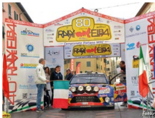
Banner, striscioni, bandiere, spazi di ampia visibilità sul palco della partenza e dell'arrivo.