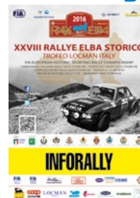
Spazi nelle brochure dedicate alla gara, stampate in 3000 copie distribuite gratuitamente e scaricabile "on line".