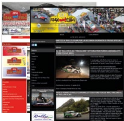
Banner statici o dinamici nei siti ufficiali delle gare.