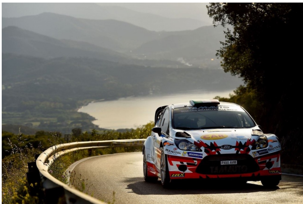
ALBERTINI, L'ULTIMO VINCITORE DELLA GARA

Una delle gare di rally più amate ed apprezzate al mondo torna nella massima collocazione di validità nazionale, da anni attesa da tutto il settore delle corse su strada.