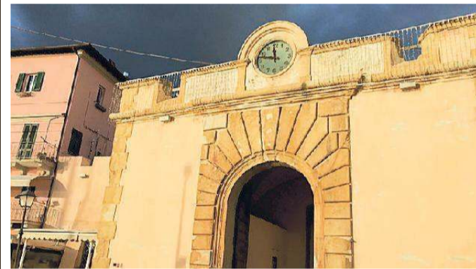
L'orologio della Porta a mare di Portoferraio