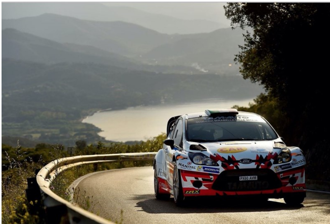
Albertini-Fappani, gli ultimi vincitori

Dopo anni di attesa il 26 e 27 maggio 2018 la gara sarà nazionale