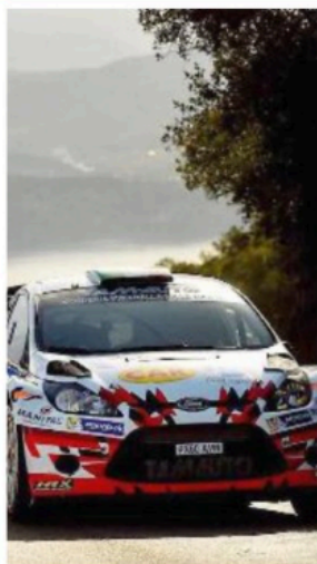
A MAGGIO Il Rally dell'Elba torna a far parte del circuito