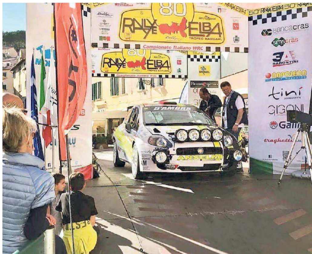
Un'auto in partenza nell'ultima edizione del Rallye Elba